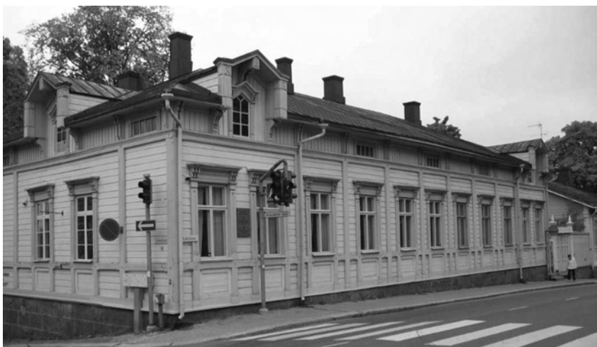
Sukutarinaseminaari kokoontui Palanderin talossa, jonka historialla on yhteys Stenrothien sukuun.