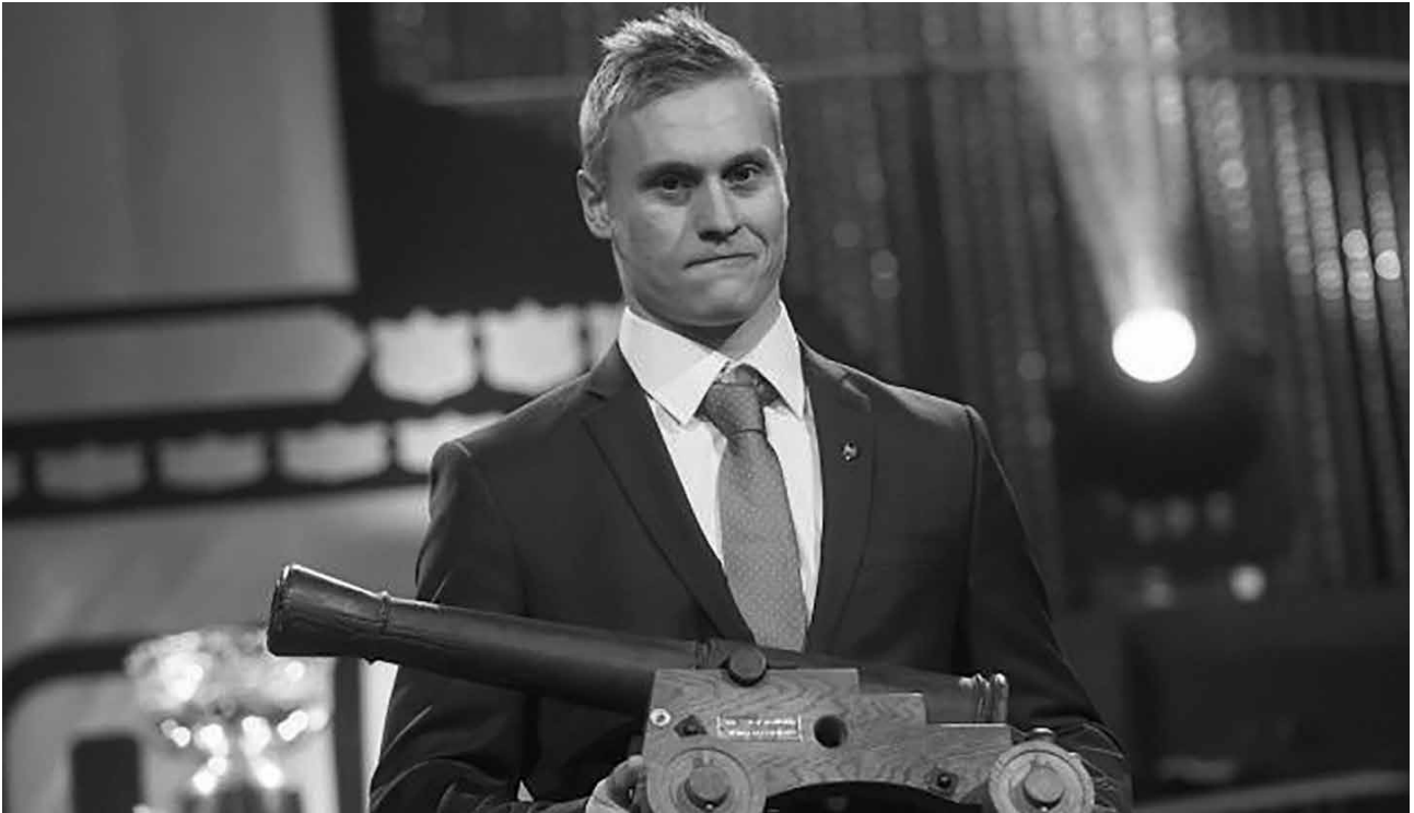
Voimaharjoittelu ja tuhannet toistot maalitykin taustalla.