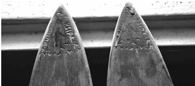
Uusituvan suksipajassa löytiin jokaiseen suksipariin yksilöllinen leima alkuperän todistamiseksi.

(Teksti on hieman lyhennetty versio Toronton Vapaa Sana -lehdelle kirjoitetusta tekstistä.)