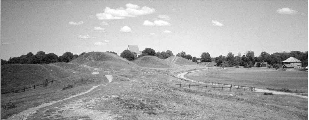
Kuningaskumpujen kätköissä voisivat levätä myös Suomen muinaisprinsessan, kuningatar Skjalv Frostentyttären maalliset jäännökset.

jälkeen maa jakautui uudelleen, koska hänen kahdellekymmenelle pojalleen annettiin kullekin oma pieni kuningaskuntansa.