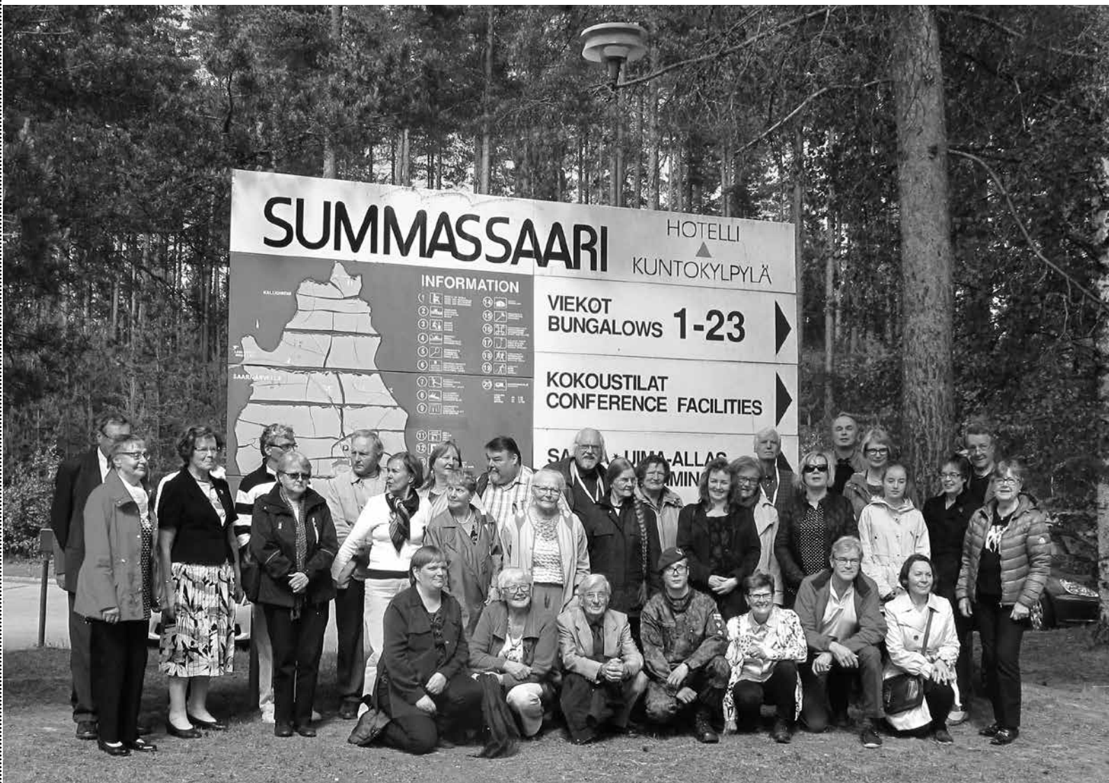
Lopuksi kokoontuimme Summassaaren pihalle yhteiskuvaan.