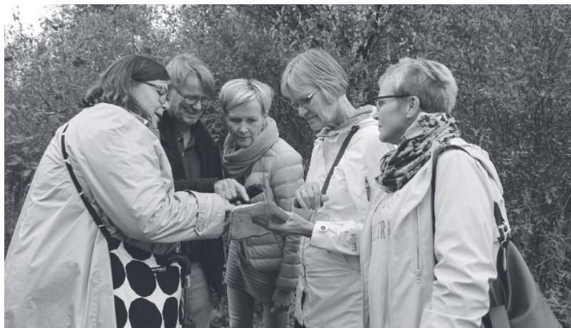
Tässä tulkitaan vuoden 1939 karttaa Säiniöllä.