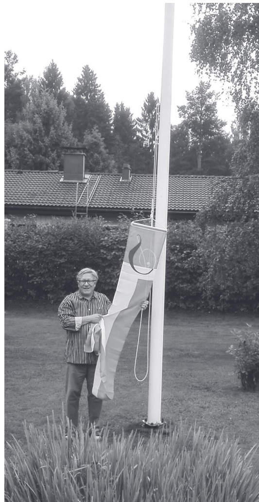
”Etkoilla” kesällä hankittu uusi sukuviiiri nostettiin juhlallisesti salkoon ensimmäistä kertaa serkkutapaamisen kunniaksi, sadepäivästä huolimatta.