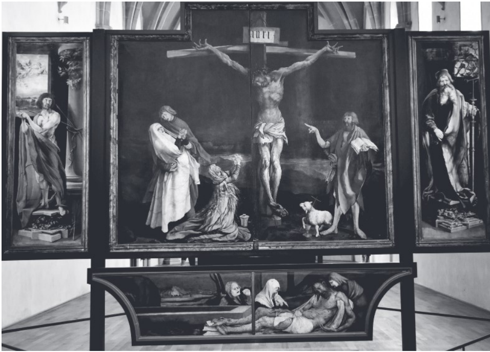
Matthias Grünewald maalasi kuuluisan alttaritaulun Issenheimin luostarikirkkoon Ranskan Alsacessa. Se on nähtävillä Unterlindenin museossa Colmarissa.