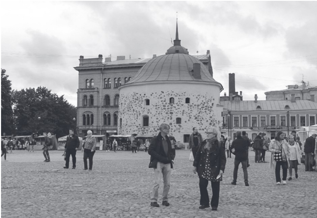
Torikierros Pyöreän tornin edustalla.

TEKSTI JA KUVAT: EIJA STENROTH | KUVAT KVARTETTO N s. 79-81