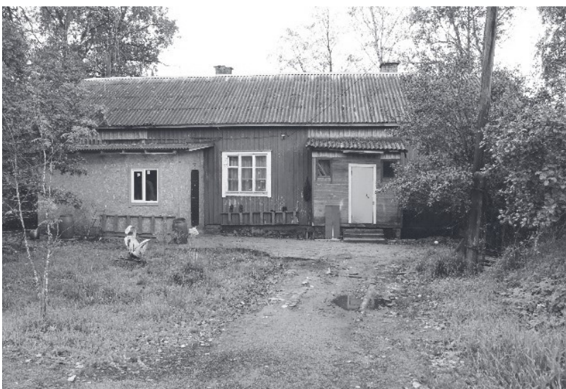
Säiniön aseman tilalle rakennettu ”tönö” vuonna 1939.

lähelle isiemme asuinsijoja. Viipuri yllätti positiivisesti!